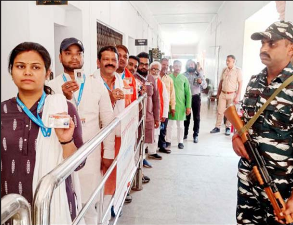
ઉત્તર પ્રદેશમાં વિધાન પરિષદ (એમએલસી)ની ખાલી પડેલી ૩૬ બેઠકોની ચૂંટણીના શનિવારે યોજાયેલા મતદાન દરમિયાન વારાણસીમાં એક મતદાન કેન્દ્ર પર મતદારોની મત આપવા માટે લાઈન લાગેલી છે અને બાજુમાં સ્થિતિ પર નજર રાખીને સુરક્ષા દળનો જવાન ઉભેલો નજરે પડે છે.

બજેટ અનુમાન ૧૧.૦૨ લાખ કરોડની સામે પરોક્ષ કર સંગ્રહનો વાસ્તવિક આંકડો વાર્ષિક દ્રષ્ટિએ ૨૦% વધીને રૂ. ૧૨.૮૦ લાખ કરોડ થયું છે. તેમાં કસ્ટમ ડ્યુટીનો હિસ્સો ૪૮% વધીને રૂ. ૧.૮૮ લાખ કરોડ થયો છે, જ્યારે કેન્દ્રીય જીએસટીનો હિસ્સો ૩૦% વધીને રૂ. ૬.૮૫ લાખ કરોડ થયો છે. જોડે આયાત ડ્યુટી સામાન્ય ધટીને રૂ. ૩.૮૮ લાખ કરોડ થઈ હતી. આ દરમિયાન ૨.૪૩ લાખ કરદાતાઓને ૨.૨૪ લાખ કરોડ રૂપિયાનું રિફંડ પણ આપવામાં આવ્યું હતું.