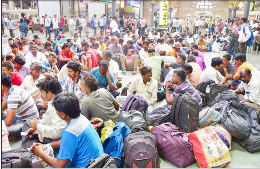
મહારાષ્ટ્રમાં સ્ટેટ રોડ ટ્રાન્સપોર્ટ કોર્પોરેશન (રાજ્ય માર્ગ પરિવહન નિગમ)ને રાજ્ય સરકાર સાથે મર્જ કરવાની માગણી લઈને આંદોલન કરી રહેલા નિગમના કર્મચારીઓ મુંબઈમાં છત્રપતિ શિવાજી મહારાજ ટર્મિનસના પ્લેટફોર્મ પર ધરણા પર બેસી દેખાવો કરી રહ્યા છે.